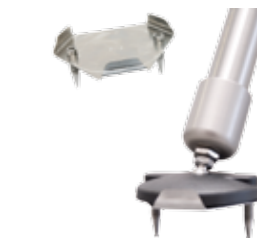
Item No. Art. Nr. 8321-2700 SET