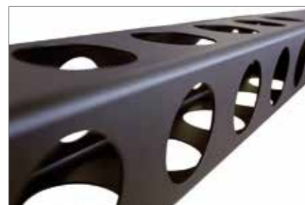
Section 120 light and robust