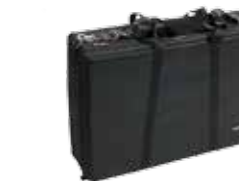
Item No. Art. Nr. 822151