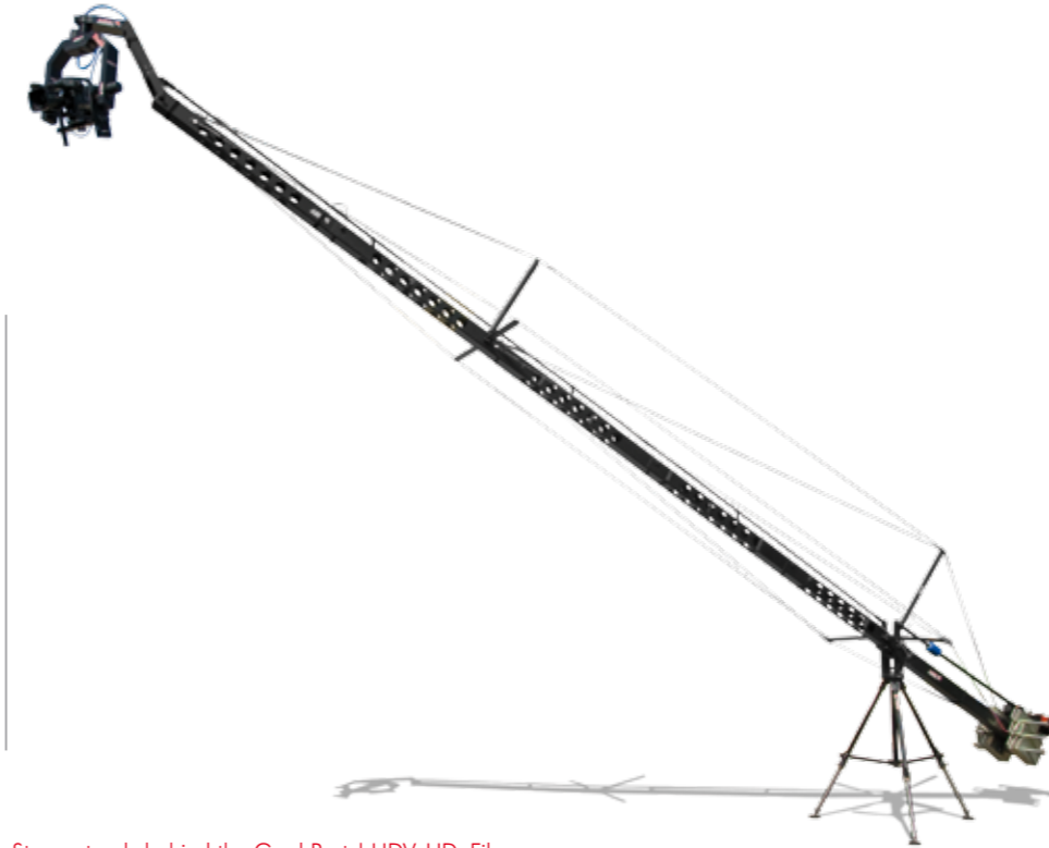
Crane120 - 9.0

The Star, not only behind the Goal Posts! HDV, HD, Film High weight capacity of 25kg (55.11 lb)