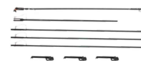
Item No. Art. Nr. 8315-950