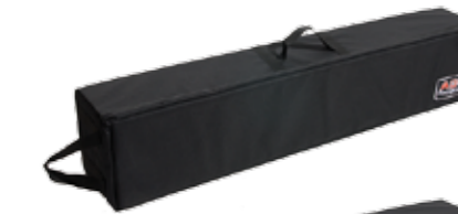
Item No. Art. Nr. 832150